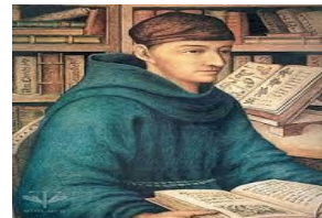
Fray Bernardino de Sahagún

En 1526 los dominicos , quienes, en Oaxaca y Chiapas, y otras regiones, hicieron labor de evangelización y de cultura, como fray Bartolomé de las Casas, protector de los indios y cronista, que escribió Brevísima relación de la destrucción de las indias y un Memorial.