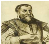
Diego Velázquez de Cuellar

En 1517, Diego Velázquez, gobernador de Cuba, envió a explorar tierra firme a Francisco Hernández de Córdoba, quien llegó a playa del Carmen, Cozumel, Yucatán y Champotón, donde resultó herido y tuvo que retornar a Cuba, donde murió poco tiempo después.