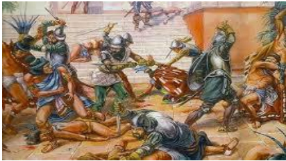
La matanza del Templo Mayor (1520)

Mientras estos sucesos se producían en Cempoala, en México se sublevaron sus moradores porque Pedro de Alvarado había asesinado a nobles y sacerdotes mexicas reunidos en el Templo Mayor, este atentado provocó la ira contra los españoles.