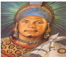
Moctezuma II tlatoani mexica

Posteriormente Cortés planeaba capturar a Moctezuma II para evitar que incitara a su pueblo, y así poder acabar con él y sus aliados. Se presentó ante Moctezuma y le pidió que se alojara con él en sus aposentos, en donde sería servido como si estuviera en su casa; afirmó que no quería hacer la guerra ni destruir su ciudad. Así el monarca mexica se convirtió en prisionero de Cortés, y para afrentarlo más, ordenó colocarle grilletes.