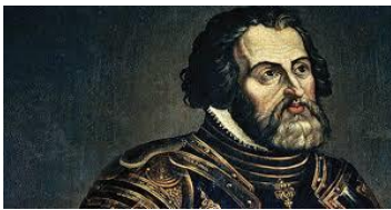
Hernán Cortés Conquistador de México

En Tabasco los nativos atacaron a Cortés y a sus soldados, pero los tabasqueños fueron vencidos, los nativos le entregaron presentes a Cortés, entre ellos enviaron comida y mujeres, como la Malinche, quien se convirtió junto con Jerónimo de Aguilar, en personaje trascendente debido a que suministraron información a Cortés acerca de las relaciones entre los mexicas y los pueblos tributarios, factor importante que facilitó la conquista,