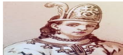
Malinche interprete y traductora