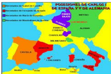
Expansión de la Corona española en el siglo XV

Entre las características de una monarquía están: es ejercido por una sola persona que es el monarca, es vitalicia, es decir, el monarca gobierna de manera vitalicia hasta su muerte, abdicación o en su caso derrocamiento y generalmente es hereditaria, aunque también se da el caso de ser electiva.