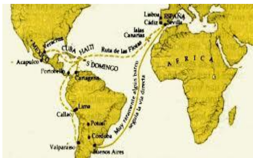
Ruta comercial de la colonia

El comercio propició el nacimiento de las ferias y el florecimiento de dos puertos: Veracruz y Acapulco, a donde llegaban, respectivamente, los galeones de Sevilla y la Nao de Manila o de China provenientes de Filipinas. Es importante señalar que este tipo de comercio solo benefició a unos cuantos.