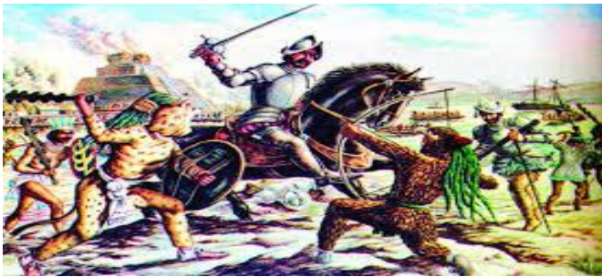
La caída de Tenochtitlan

En 1525 Cortés partió a las hibuera, llevando a Cuauhtémoc y al señor de Tlacopan, pero como sospechaba que intrigaban contra él, los asesinó