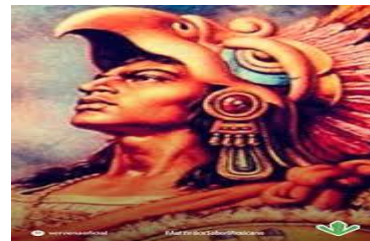
Cuauhtémoc último tlatoani azteca