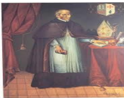
Fray Vasco de Quiroga