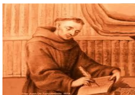
Fray Juan de Torquemada