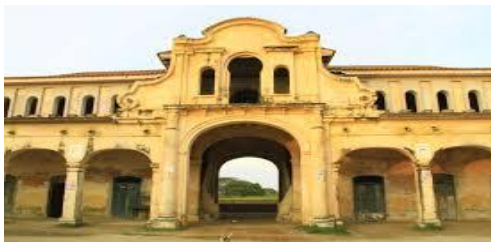
Hacienda de la Nueva España

En el caso de la ganadería fue diferente. La rápida proliferación de las especies traídas por los españoles ocasionó que esta actividad no tuviera que sufrir lentos procesos de adaptación de la agricultura. A mediados del siglo XVI, cerdos, ovejas, cabras y gallinas eran ya elementos importantes en la dieta y en las actividades comerciales de la población. Además, se contó con una nueva fibra textil: la lana, que transformó la vestimenta en muchas regiones. En cuanto al transporte de mercancías, los burros y las mulas sustituyeron gradualmente a los cargadores indígenas (tamemes).