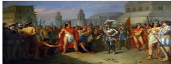
Encuentro entre Moctezuma y Cortés

Moctezuma II recibió a Cortés el 8 de noviembre de 1519. Este y sus capitanes fueron alojados en el palacio de Axayácatl.