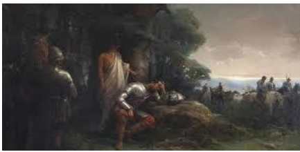
La noche triste

Un español que llegó con Narváez era portador de la viruela y desató una peste que azotó a los pueblos mesoamericanos; una víctima de este mal fue Cuitláhuac, quien había sustituido a Moctezuma II y encabezado a su pueblo contra los invasores. Cuando murió Cuitláhuac, el nuevo tlatoani fue Cuauhtémoc; el hijo del Ahuizotl encabezó a su pueblo en defensa de su ciudad.