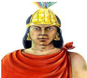
Cuitláhuac señor de Iztapalapa

Cuauhtémoc, sobrino de Cuitláhuac, se presentó ante Moctezuma y los españoles, y lo atacó con estas frases: “qué dice ese bellaco de Moctezuma mujer de los españoles, que de puro miedo se entregó a ellos y asegurándose él, nos ha puesto en este trabajo, ya no lo queremos obedecer porque ya no es nuestro rey y como a vil hombre le hemos de dar el pago y castigo que se merece...” y concluyendo con estas palabras le arrojó una piedra que lo hirió en la cabeza bañándolo en sangre. A los pocos días murió Moctezuma; otra versión dice que Cortés lo había acuchillado antes; el deceso de Moctezuma fue el 27 de junio de 1520.