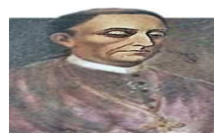
Fray Diego de Landa

Como parte del proceso de evangelización, se implantó una nueva cultura y costumbres a partir de la destrucción de la cultura prehispánica.