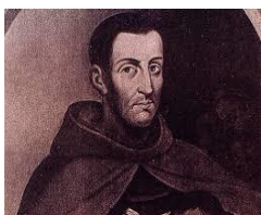
Fray Pedro de Gante

Fray Bernardino de Sahagún, maestro investigador y cronista, que gracias a su obra Historia general de las cosas de Nueva España fue preservada una porción muy importante de la historia prehispánica.