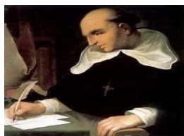
Fray Bartolomé de las Casas

Llegaron también Diego de Durán, Juan de Torquemada y Diego de Landa predicadores y cronistas. Este último por su celo religioso hizo quemar los códices mayas, perdiéndose la mayor parte de ellos.