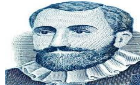
Francisco Hernández de Córdoba